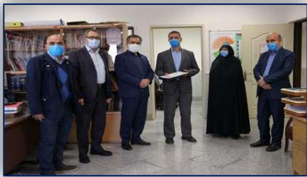
به مناسبت میلاد حضرت علی (ع) از تعدادی رزمندگان هشت سال دفاع مقدس شاغل در ستاد مرکزی دانشگاه تجلیل شد ۹۹/۱۲/۰۵