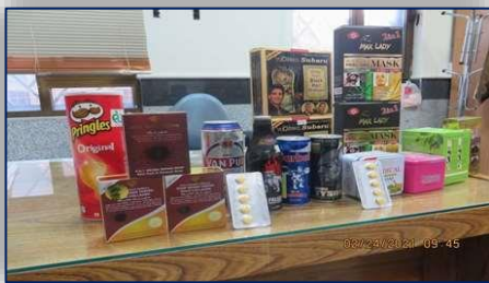
کشف و توقیف اقلام قاچاق غیرمجاز در سمنان ۹۹/۱۲/۰۹