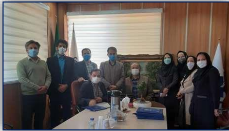
برگزاری مراسم بزرگداشت روز مرد و مقام پدر در معاونت درمان دانشگاه ۹۹/۱۲/۰۶