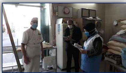
گشت مشترک واحد مهندسی بهداشت محیط مرکز بهداشت شهرستان سمنان و سازمان صمت ۹۹/۱۲/۱۰