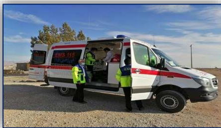
ادامه طرح پایش ضربتی اورژانس پیش بیمارستانی در شهرستان دامغان ۹۹/۱۲/۰۹