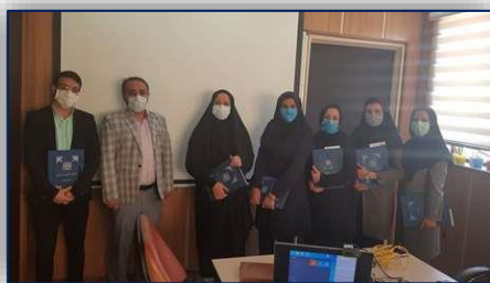
قدردانی مدیر درمان دانشگاه از مددکاران بیمارستان های تحت پوشش دانشگاه ۹۹/۱۲/۰۶