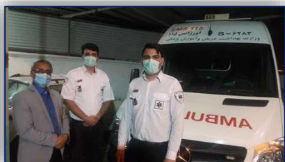
بازدید بامدادی مدیر شبکه بهداشت و درمان شهرستان گرمسار از پایگاه های اورژانس ۱۱۵ و بیمارستان معتمدی ۹۹/۱۲/۲۳