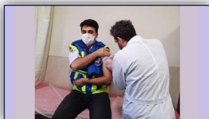
آغاز فاز اول واکسیناسیون کرونای تکنسین های فوریت های پزشکی دانشگاه علوم پزشکی استان سمنان ۹۹/۱۲/۲۵