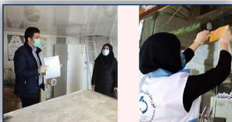
تعطیلی دو واحد متخلف نانوايي و يك واحد ميوه فروشي شهرستان سمنان به علت عدم رعايت موازين بهداشتی ۹۹/۱۲/۰۹