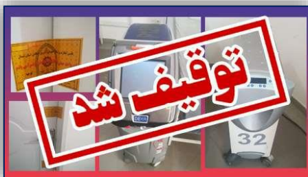
انجام لیزر تراپی توسط افراد فاقد صلاحیت در مطب پزشکان تخلف محسوب می شود ۹۹/۱۲/۰۶