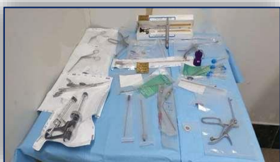
اهدای تجهیزات جراحی گوش و حلق و بینی به بیمارستان کوثر ۹۹/۱۲/۲۵