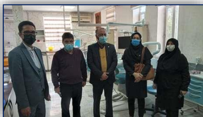
تشدید نظارت ها بر اجرای پروتکل های بهداشتی در مراکز درمانی ۹۹/۱۲/۱۳