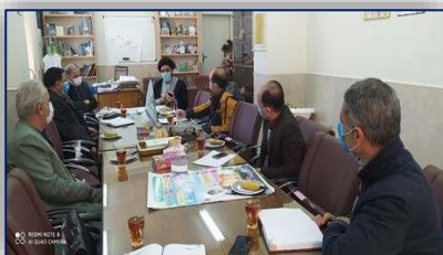
نشست رئیس مرکز بهداشت سمنان و نماینده دادستان و رئیس شعبه ۸ دادیاری دادگستری سمنان ۹۹/۱۲/۱۲