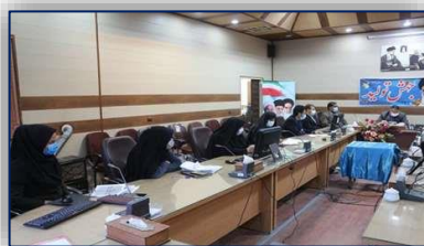
کمیته تخصصی برنامه پیشگیری از بد رفتاری با کودکان در شرایط کووید ۱۹ در شهرستان سرخه برگزار شد ۹۹/۱۲/۲۰