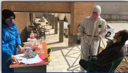
استمرار حضور تیم مراقبتی شهید سلیمانی مرکز بهداشت سمنان در اماکن تجمعی ۹۹/۱۲/۰۶