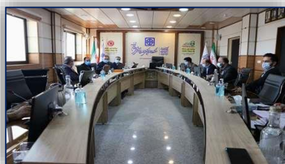
جلسه کمیته پدافند غیر عامل دانشگاه علوم پزشکی استان سمنان ۹۹/۱۲/۱۸