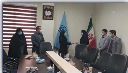
قدردانی مدیر منابع انسانی دانشگاه از مسئول کارگزینی دانشکده پیراپزشکی سرخه ۹۹/۱۲/۰۹