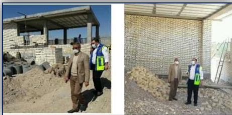
بازدید مدیر شبکه بهداشت و درمان شهرستان گرمسار از پروژه در حال ساخت پایگاه اورژانس ۱۱۵ ده نمک ۹۹/۱۲/۰۶