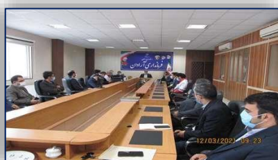
جلسه ستاد بحران شهرستان آرادان برگزار شد ۹۹/۱۲/۲۰