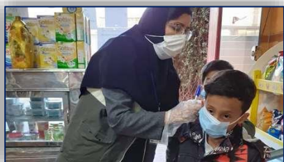
بازدید عضو تیم نظارت بسیج تحت پوشش مرکز خدمات جامع سلامت ایوان کی شهرستان گرمسار از اماکن عمومی ۹۹/۱۲/۱۰